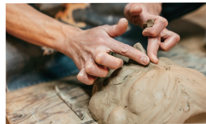
石見神楽面の型を整える粘土塑像の工程作業。

のでしょうか。技術発展で何でもできる現代ですが、心の豊かさを求める人に共感して訪れてもらえる場所でありたいです。