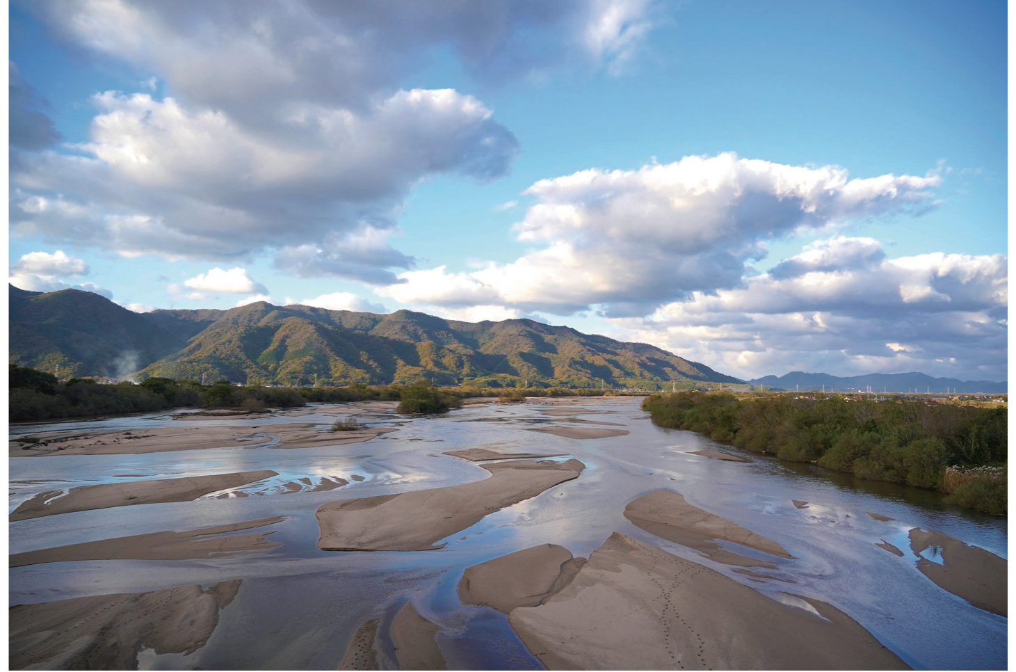
ひいかわ 斐伊川の氾濫がヤマタノオロチ伝説を生んだと伝わる。