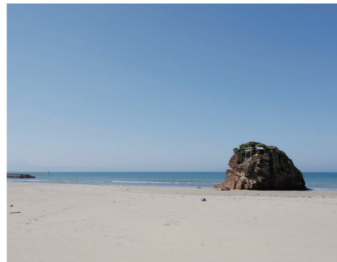
いなき 海から来る神々を迎える稲佐の浜。 出雲大社から徒歩15分ほどの距離にあり夕日景勝地でもある。

島 根と沖縄。遠く離れた2つの地の根底に流れているものは「自然崇拜」です。琉球王朝の流れを汲む沖縄には、古くから続く自然崇拜がそのままの形で残り、鳥居や社は見られず、自然そのものが祈りの対象となっています。対する島根は、自然の中に存在する「八 やお 百万 よろず の神」の神話の舞台。こうした歴史を背景に、沖縄獅子舞 いわみ や石見神楽 かぐら といった神事など、それぞれ固有の伝統文化が発展を遂げたと考えられます。