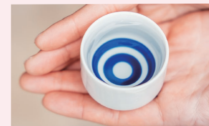
島根の酒造りは半島から伝承され発展を遂げた。

らず。なによりお酒を囲む家族団樂のときが楽しく、幸せな気持ちにさせてくれます。これが一番のウェルネスではないでしょうか。