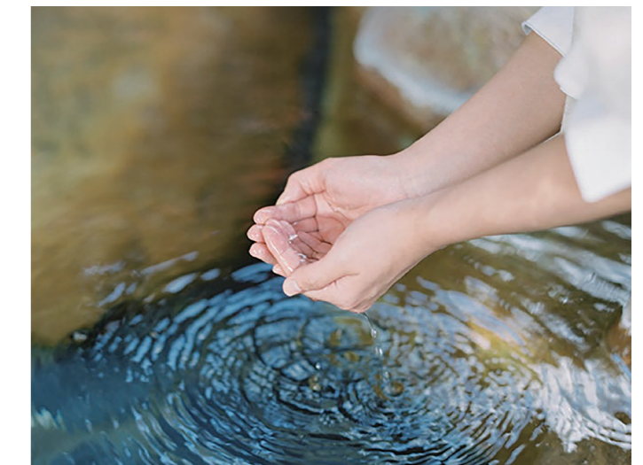
神話に登場する神々が愛した温泉が、今も変わらず各地に湧く。泉質豊富な温泉は県内に60ヶ所以上も。

心 と身体を良い状態にするための“気づき”は、旅のなかにこそあるもの。島根は神々や自然、人と人のご縁を大切にしている土地柄で、人々がしっかりと心のより所を持っている地域です。さらに湿度を保った気候や温泉、食文化といった美肌に適したライフスタイルも整っており、心身ともに癒される「ウェルネスツーリズム」の考え方とリンクする旅先です。様々なものとの「つながり」を感じて生き生きと過ごすことが、「世界一の長寿国・日本」の本質であると言えます。島根が推奨する「ご縁旅」「美肌旅」を通じて自然・人・地域とつながる時間は、豊かな人生をデザインするためのきっかけになるでしょう。