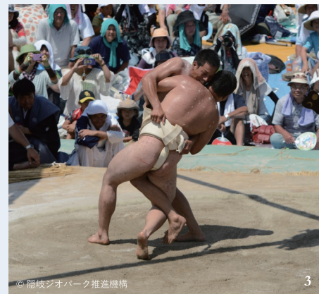
1 / 石見神楽は各地で定期公演が行われている。写真は温泉津温泉 夜神楽の演目「大蛇」。 2 / 舞い手、奏者、客席が一体感に包まれていく。 3 / 子どもも大人も、島民が熱狂するドラマが繰り広げられる隠岐古典相撲。