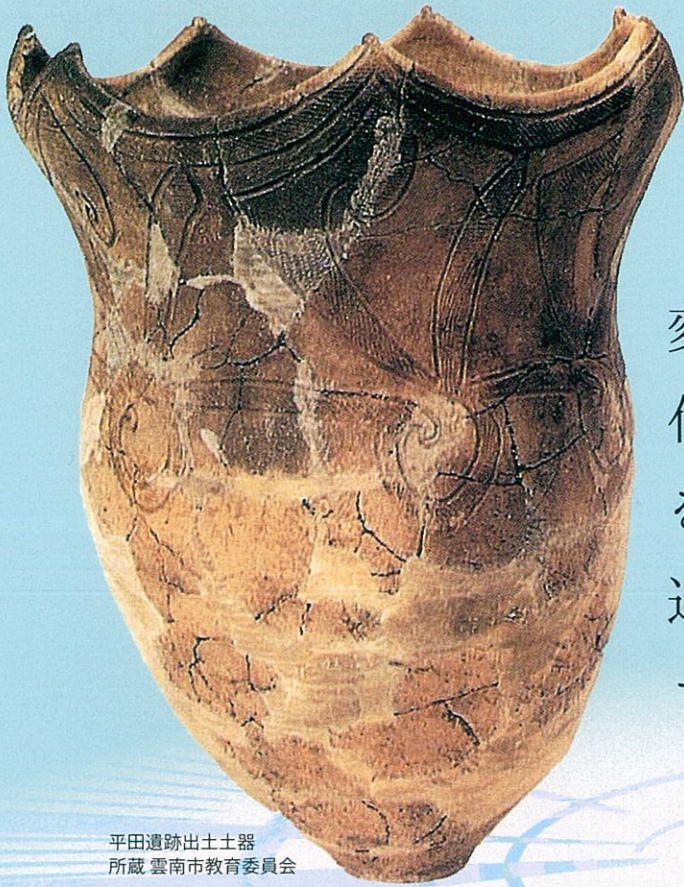
平田遺跡出土土器 所蔵 雲南市教育委員会