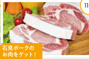
石見ポークのお肉をゲット!