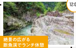
絶景の広がる断魚溪でランチ休憩