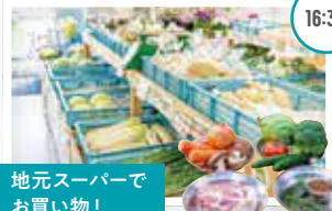
地元スーパーで買い物!