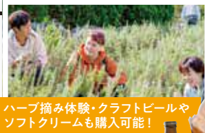
ハーブ摘み体験・クラフトビールやソフトクリームも購入可能!