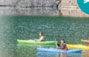
カヤックに乗って買い出しに行こう!