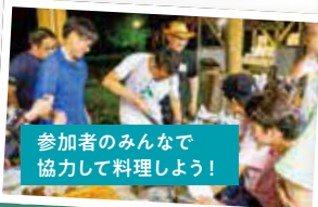
参加者のみんなで協力して料理しよう!