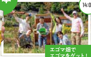
エゴマ畑でエゴマをゲット!