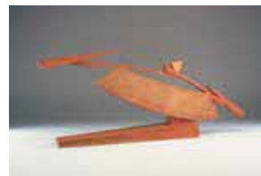
澄川喜一《そのりあるかたち97-1》1997(平成9)年

「水を画題とする絵画」をゆったりと鑑賞いただけるよう「水辺の展示室」を新設。また、当館が誇る北斎コレクションを常時30点程度入れ替えながらご覧いただけるよう、展示室2を「北斎展示室」としてリニューアルしました。