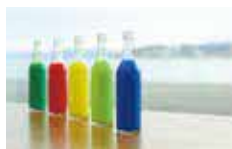
「色水あそび」※イメージ

毎月第3日曜日のしまね家庭の日にあわせ造形ワークショップをスタート(島根大学教育学部川路澄人教授企画・監修)。詳しくは美術館ホームページをご確認ください。