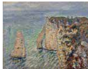
クロード・モネ《アヴァルの門》1886年