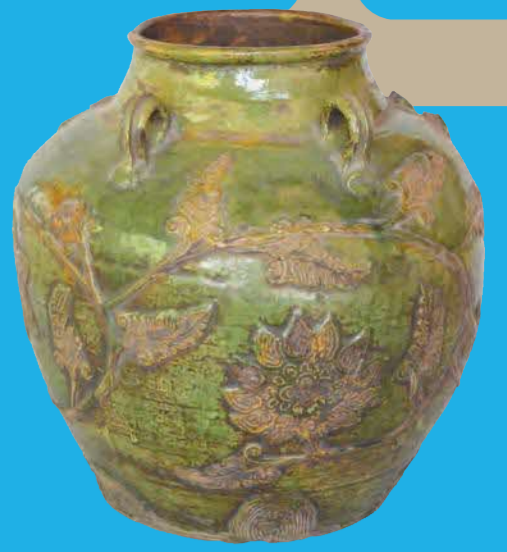
華南三彩貼花文五耳壺 萬福寺所蔵 益田市指定文化財