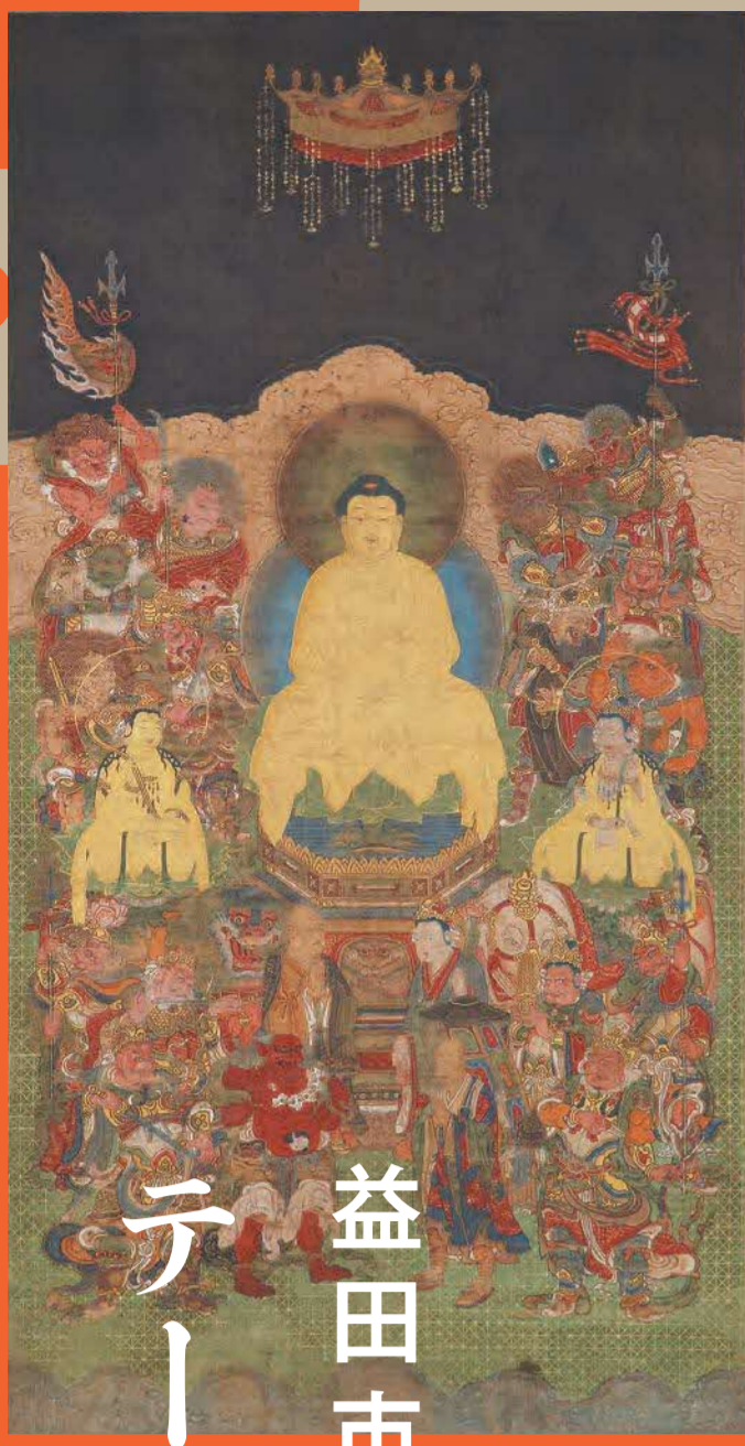
釈迦十六善神像 泉光寺所蔵 島根県指定文化財