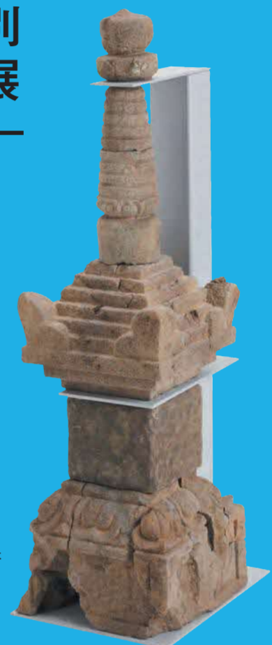
東仙道土居遺跡出土宝篋印塔