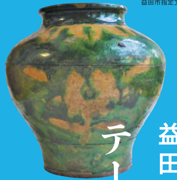
華南三彩牡丹文壺 染羽天石勝神社所蔵 益田市指定文化財