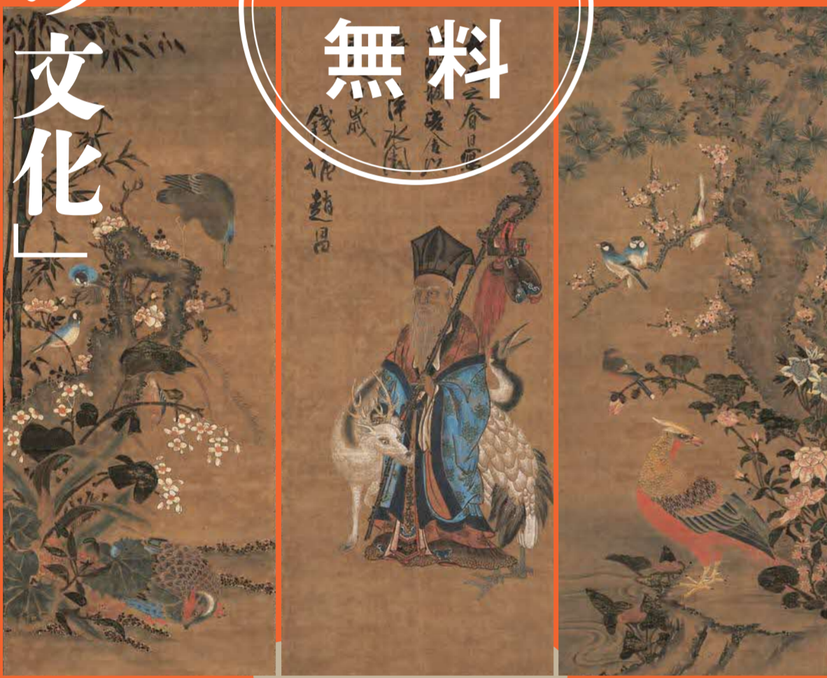
寿老・花鳥図 妙義寺所蔵