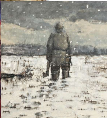
《流れはるかなアムールの・・・》