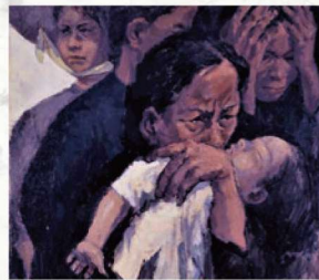
《ヴェトナムの母子》©四國五郎(すべて)