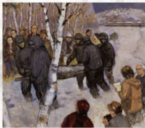
《1946年埋葬者を搬ぶ私を写生する1993年の私》