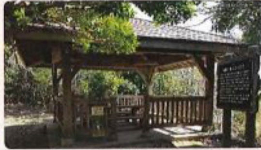
② 馬着山中間の東屋