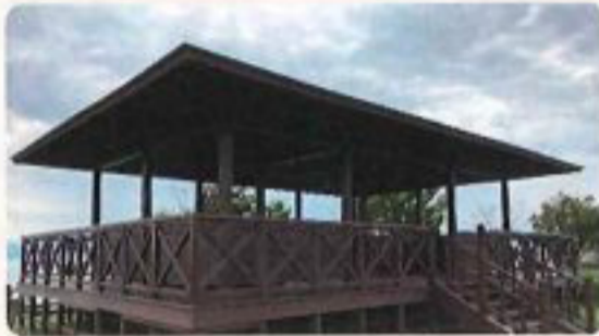
① 五本松公園の東屋