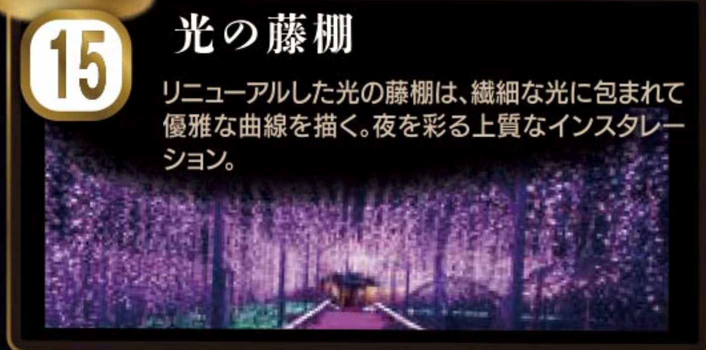
15 光の藤棚 リニューアルした光の藤棚は、繊細な光に包まれて優雅な曲線を描く。夜を彩る上質なインスタレーション。