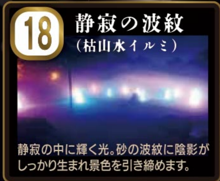
18 静寂の波紋 (枯山水イルミ) 静寂の中に輝く光。砂の波紋に陰影がしっかり生まれ景色を引き締めます。