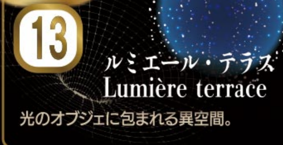
13 ルミエール・テラス Lumière terrace 光のオブジェに包まれる異空間。