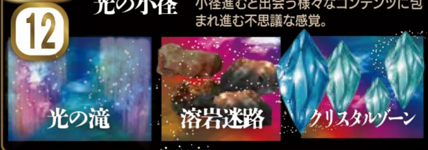
12 光の小径 小径進むと出会う様々なコンテンツに包まれ進む不思議な感覚。 光の滝 溶岩迷路 クリスタルゾーン