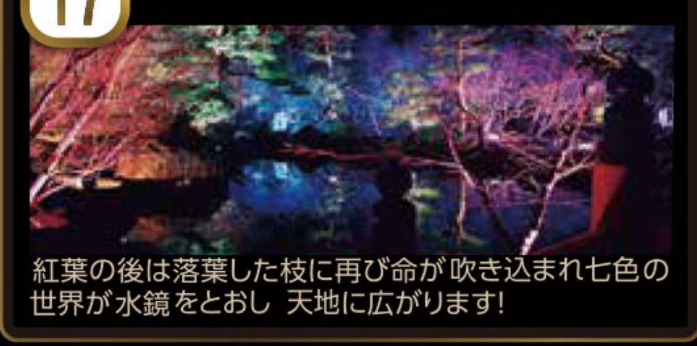
17 七色の鏡の池 紅葉の後は落葉した枝に再び命が吹き込まれ七色の世界が水鏡をとおり 天地に広がります!