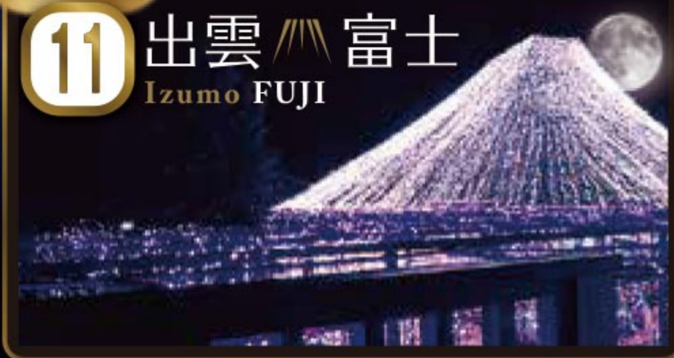
11 出雲 富士 Izumo FUJI