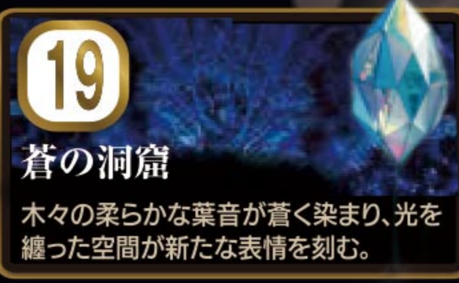
19 蒼の洞窟 木々の柔らかな葉音が蒼く染まり、光を纏った空間が新たな表情を刻む。