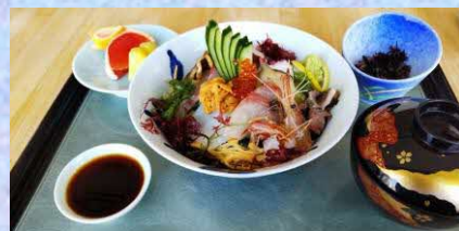
神楽めし(えびす丼)※イメージ